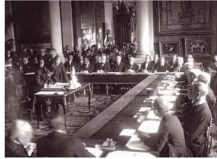
Sevr Antlaşması imzalanırken, 1920