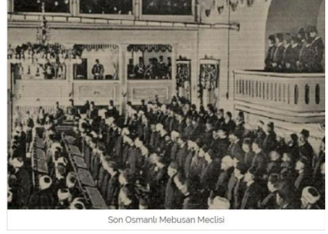
Son Osmanlı Mebusan Meclisi