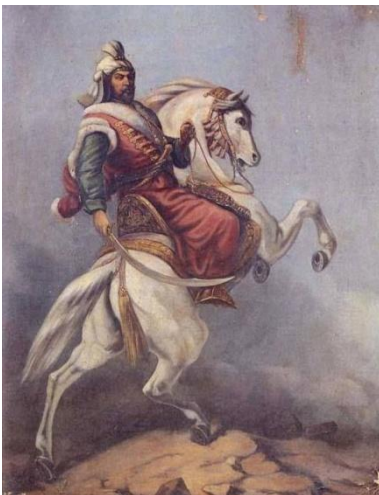
Sultan Murad IV, Sultan Murad IV