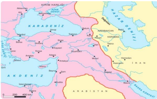
Kasr-i Şirin Antlaşmasına Göre Osmanlı - Safevi Sınırı