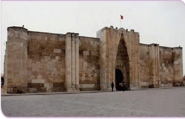
Görsel 1.15: Sultan Hanı - Aksaray

• Konya'da Mevlana Celaleddin-i Rumi 13. yüzyılda yaşamış ve ünlü Mesnevisini kaleme almıştır.