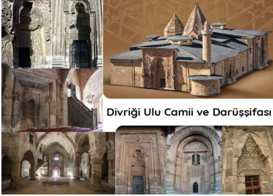
Divriği Ulu Camii ve Darüşşifası