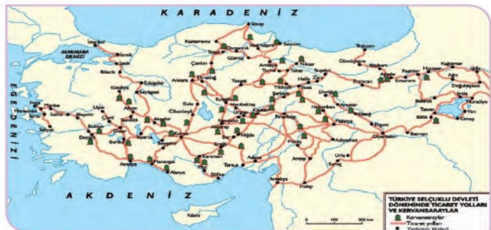
Harita 1.2: Türkiye Selçuklulari Dönemi'nde Anadolu'daki başlıca ticaret yolları